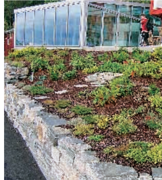
Private hageanlegg utgjør ikke så stor andel av oppdragene på Sunnmøre, men det finnes likevel en del gode eksempler på fagmessig utførte uterom.

I det forebyggende ugrasarbeid stilles det imidlertid andre krav til dekkematerialer enn i mindre vindutsatte områder.