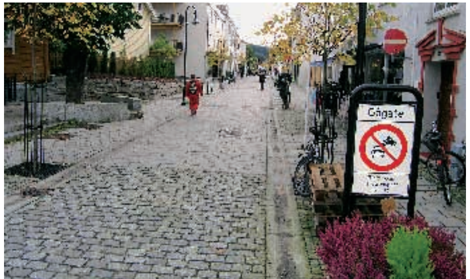
Vikegata er blitt gågate og en trivelig sentralakse i Ørsta. Planting og steinarbeider er utført av Anleggsgartner Jan Erik Sandal AS.