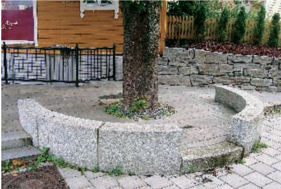
Et gammel hestekastanje fikk stå etter mye diskusjon og omfattende kronereduksjon. Huset i bakgrunnen kalles da også "Kastanjen". Stammen blir beskyttet av spesialskåret granitt fra Beer Sten A/S.