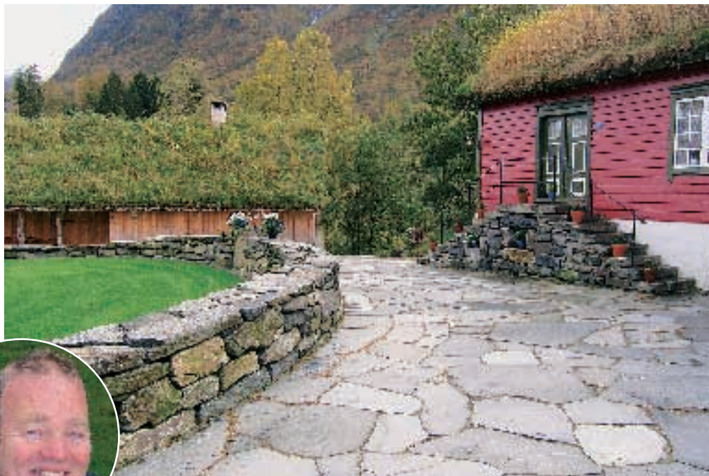
Rekkedal Gjestehus i Bondalen har fått et stilriktig tun med halvsirkelformet mur, ny trapp og belegning av grovskåret skifer. Anlegget er utført av Harald Aarset hos Anleggsgartner Jan Erik Sandal AS.